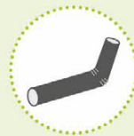
Recycleerbare harde kunststoffen