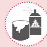
Klein gevaarlijk afval van vergelijkbare bedrijfsmatige oorsprong