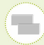
Gipskartonplaten en gipsblokken*