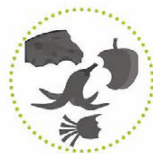
Keukenafval en etensresten