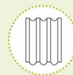
Bitumineus dakbedekkingsmateriaal of afdichtingsmateriaal**