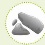
Funderingsmaterialen die niet conform de bepalingen van het eenheidsreglement gerecycleerde granulaten kunnen verwerkt worden