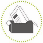
Papier en Karton