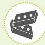
Inert puin, bestaande uit betonpuin, metselwerkpuin of mengpuin