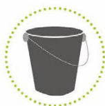
Recycleerbare harde kunststoffen