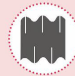
Asbestcementhoudende afvalstoffen en asbest-verdachte materialen