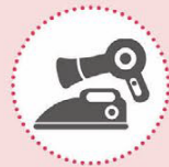
Afgedankte elektrische en elektronische apparaten