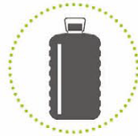
Gebruikte dierlijke en plantaardige oliën en vetten